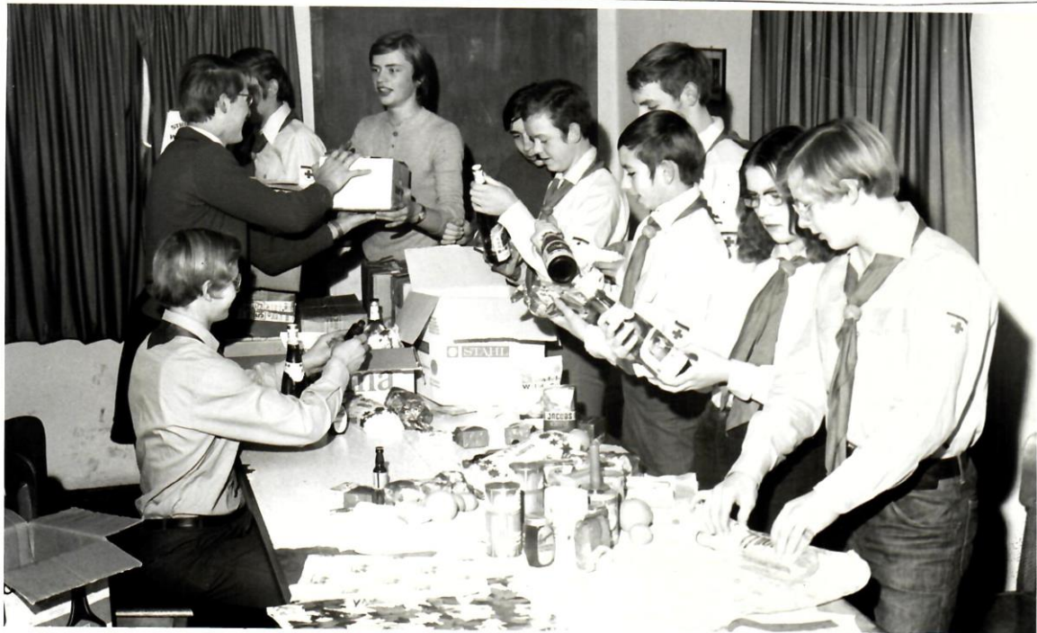
Die Bad Essen JRK-Gruppe beim Einpacken von Weihnachtspäckchen