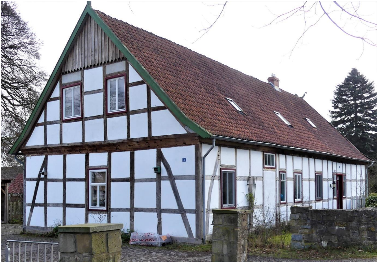
In diesem Fachwerkgebäude, Dorfstraße 3, Eielstädt, in dem einst der Hausmeister der Leuchtenburg wohnte, befanden sich gut ein Jahrzehnt die JRK-Jugendräume

© Copyright 2019 – Alle Rechte an vorstehenden Texten und Abbildungen sind urheberrechtlich geschützt. Rechteinhaber ist der Verfasser. Dieser Beitrag wurde mit Unterstützung des gemeinnützigen Vereins „Centrales Ländliches Vereins-Archiv e.V.“, Bad Essen, veröffentlicht.